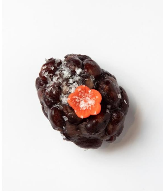
創業万延元年 函館宝来町 千秋庵総本家 HAKODATE SENSYUAN SOHONKE