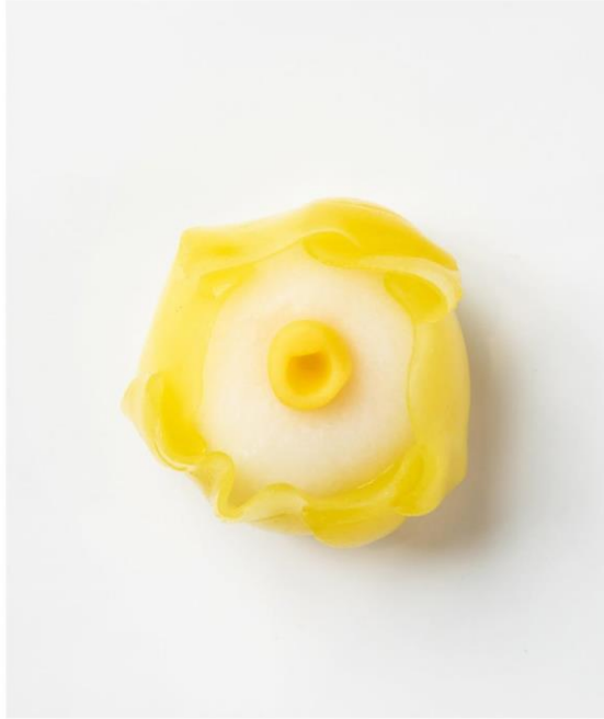
創業万延元年 函館宝来町 千秋庵総本家 HAKODATE SENSYUAN SOHONKE