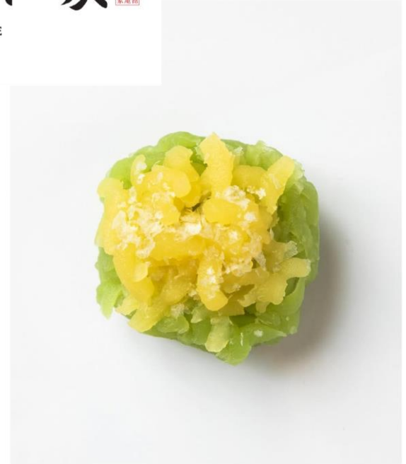
創業万延元年 函館宝来町 千秋庵総本家 HAKODATE SENSYUAN SOHONKE